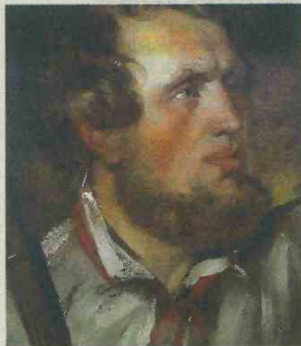
Der Held im Bild: Dieser um 1836 von Philipp Wirth porträtierte Holzfäller soll mehrere Menschen aus einem brennenden Haus gerettet haben.