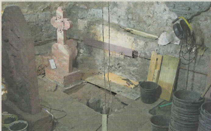
Wo ein weiterer Grabstein stehen sollte, ist nun das Eingangsloch zum Latrinenhohlraum.

Leute waren – sie hatten es nicht nötig, jedes Stückchen Brennmaterial zum Heizen aufzubewahren. Die Konstruktion der Latrine lässt darauf schließen, dass an der Stelle des heutigen Museumsgebäudes neben der Alten Amtskellerei ein anderes, wesentlich stattlicheres Haus gestanden haben muss. Funde in Heidelberg zeigten, dass beim Hausbau zuerst die Latrine im zweiten Untergeschoss angelegt wurde – und zwar mit denselben Außenwänden wie der Rest des Hauses. Die Museumslatrine geht über den Grundriss des jetzigen Gebäudes hinaus. bin