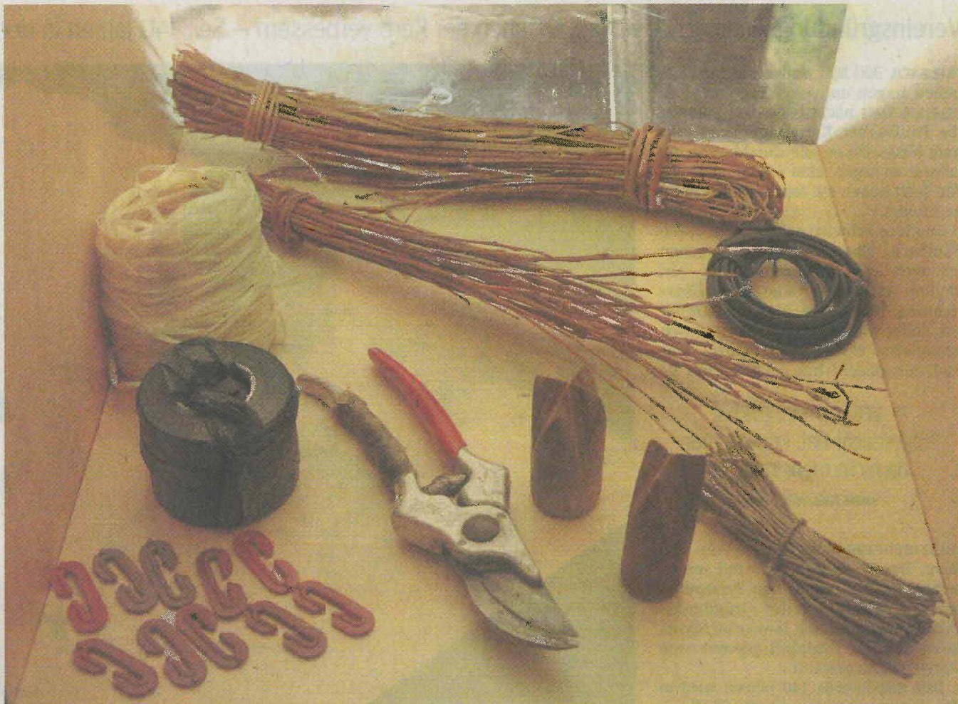
Eine Rebschere für den Schnitt und die verschiedenen Utensilien zum Binden den Weinstöcke zeigt diese Vitrine. Der schweren Arbeit im Weinberg ist ein wichtiger Teil der Ausstellung gewidmet.