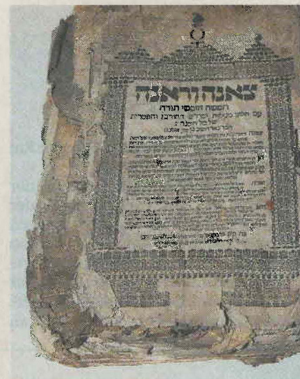
Ein Palmzweig, gestopfte Strümpfe, alte Schuhe (linkes Bild) – schützender Schutt über den wahren Schätzen: hebräische Schriften.