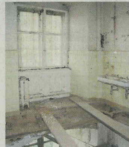
Ein Foto aus vergangenen Tagen: Vor der Sanierung fehlten im Zwickelbau die Decken.