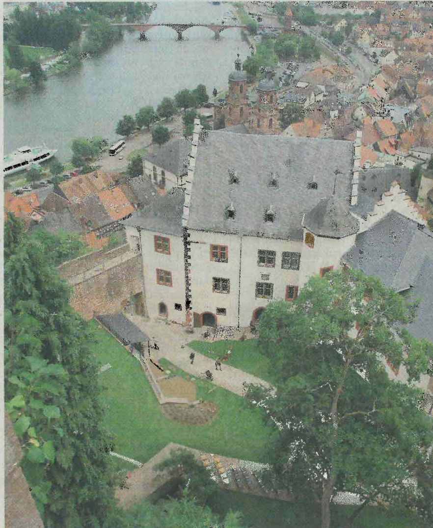
Frischer Rasen, neuer Putz: Zur Sanierung der Mildenburg gehören nur noch Kleinigkeiten. Bis zum Festakt am Samstag soll die Anlage fertig sein.

Deutliche Zugeständnisse an die Moderne sind das gläserne Kassenhäuschen, das beim Burgtor an die Stelle des alten Kiosks getreten ist. Außerdem ermöglicht ein Aufzug den barrierefreien Zugang zu allen Ausstellungsetagen. Direkt vors Burgtor fahren können Otto-Normalbesucher