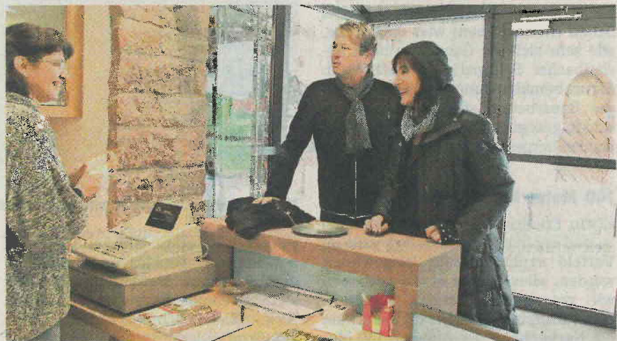
Etwa ein Drittel mehr Besuche als zur Zeit vor dem Museum standen in diesem Jahr an der Kasse am Burgtor. Auch am letzten Öffnungstag der Saison, an Allerheiligen, wollten sich 70 Besucher die Dauerausstellung ansehen.