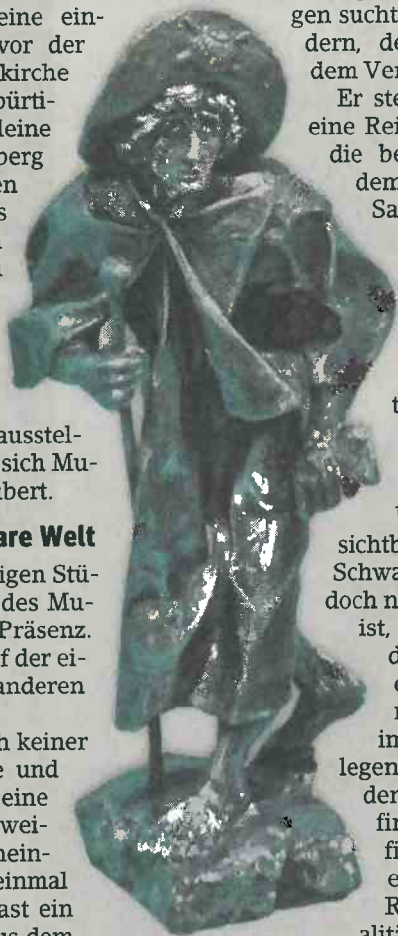
Ausgezehrt, aber von tiefem Glauben beseelt: die Bronze Pilgerbruder Jacobus.

Mystisch und düster wirken viele Arbeiten Gerresheims. Der »Apostel Santiago« – gezeichnet in Bleistift – wirkt wie einem hochmittelalterlichen Altarretabel entsprungen. Wie gemeißelt seine Züge, gotisch geschwungen seine Körperhaltung. Während sich im Hintergrund ein düsterer Himmel über einer pittoresken Kirchenarchitektur erhebt. Sein Duk-